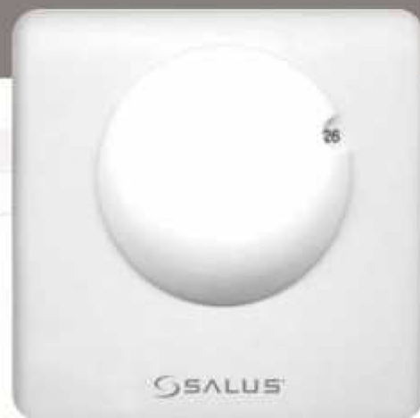
Model RT 100